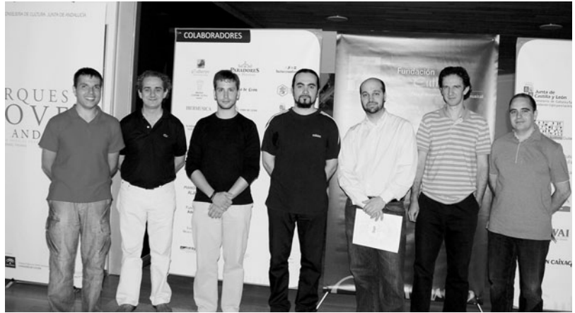
Siete de los directores de orquesta que participan en las clases magistrales organizadas por Eutherpe

años cuarenta por Sáenz de Heredia con guión del propio Franco, el artista leonés ha «cambiado» la historia «oficial» que narra el filme. Reconstruyendo fotograma a fotograma la película y con nuevas músicas de fondo, el resultado es una cinta totalmente antibelicista y no el canto de exaltación patriótica que perseguía el filme original.